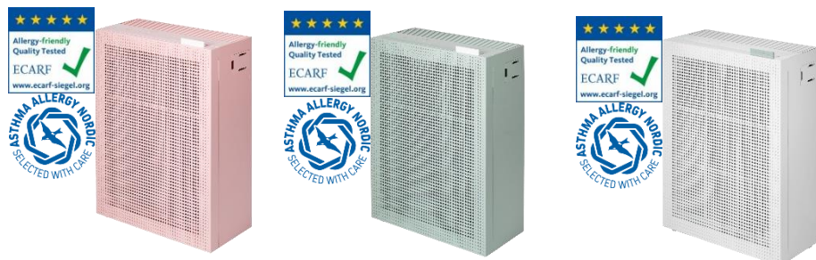
Artikel: AP-1019C (P)